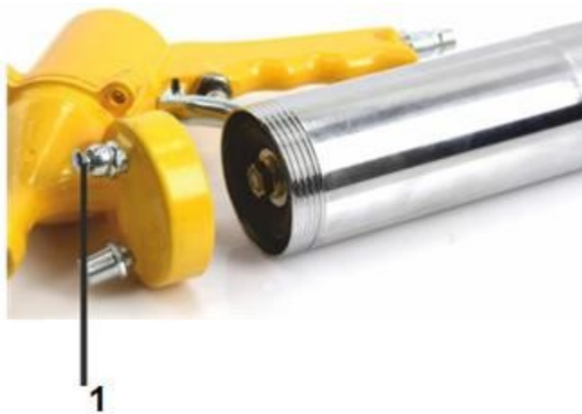
1. Вентиляційний отвір

6. За допомогою клапана випустіть повітряну подушку, що утворилася між мастилом і насадкою. Якщо її не випустити, мастило не зможе функціонувати!